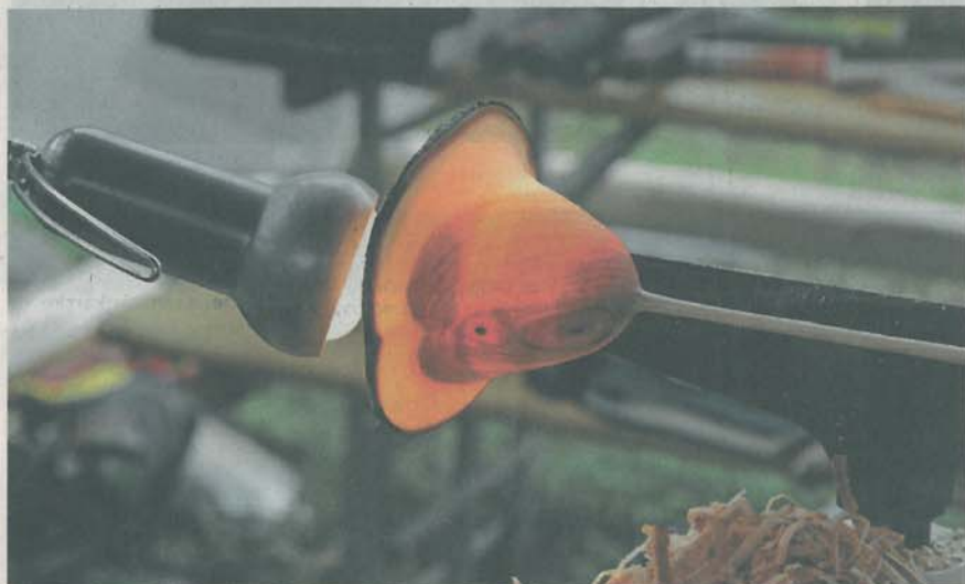
Nastal je tako tanek kozarec, da je svetloba žarnice prodirala skozi njegove stene.

sode z manj kot dva milimetra debelimi stenami iz raznih vrst lesa. Če se pošteno loti dela, izdelava dva na dan, pravi, saj je izdelava tako krhkih izdelkov zelo zamudna. Tudi zato imajo kar visoko ceno, med 80 in 100 evri, in naključnim kupcem jih prodaja zelo malo. Kakšni tuji turisti morda kupijo kdaj kakšno in slovenski protokol jih je pri njem pred kratkim kupil pet za protokolarna darila ob obisku slovenske delegacije na Japonskem.